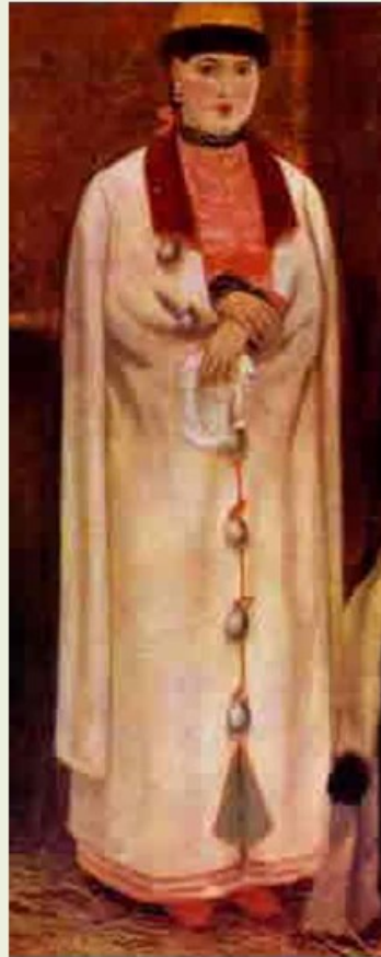
женщина в телогрее

ТЕЛОГРЕЯ по силуэту, форме деталей, тканям напоминала шубку, являлась распашкой одеждой с пуговицами или завязками.